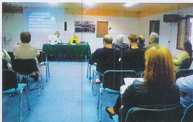
Delavnica za predstavnike lokalnih skupnosti na sejmu AGRA 2013

Na INFO točki na razstavnem prostoru ZRMK v hali A1 bo za