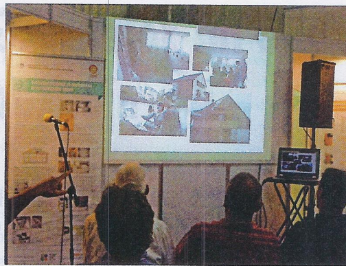
Predavanja za obiskovalce sejma AGRA

obiskovalce in stroko med soboto in četrtkom potekalo svetovanje v zvezi z izdelavo in pridobitvijo energetske izkaznice stavbe, ki jih bodo izvajali neodvisni strokovnjaki s pridobljeno licenco.