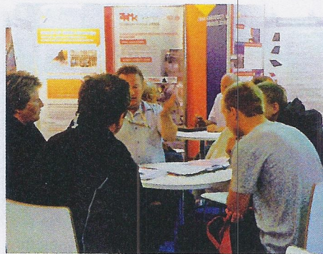
Sejem AGRA 2013

agencij in podjetij ter stroko bo v torek, 26. avgusta 2014, od 9. do 12.30 v dvorani 2 potekal posvet in okrogla miza z naslovom » Finančne perspektive za URE (učinkovita raba energije) - Pot do finančnih sredstev in nove finančne perspektive«.