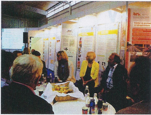
Diskusija na temo črpanja sredstev EU na sejmu AGRA 2013